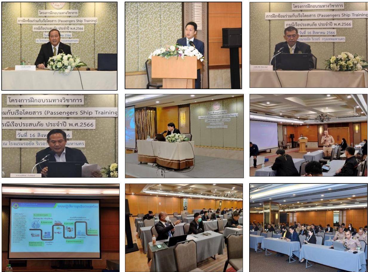
ภาพการฝึกอบรมทางวิชาการการฝึกซ้อมร่วมกับเรือโดยสาร (Passengers Ship Training) กรณีเรือประมง ประจำปี พ.ศ. 2566 วันที่ 16 สิงหาคม 2566

ในการนี้ มีหน่วยงานที่เกี่ยวข้องในระบบค้นหาและช่วยเหลือเรือประมง โดยได้เชิญผู้ทรงคุณวุฒิจากหน่วยงานวิชาการที่เกี่ยวข้องเป็นวิทยากร ได้แก่ กรมเจ้าท่า ศูนย์อำนวยความสะดวกของชาติทางทะเล สถาบันการแพทย์ฉุกเฉินแห่งชาติ สำนักงานสืบสวนอุบัติเหตุทางน้ำ และสำนักงานคณะกรรมการค้นหาและช่วยเหลืออากาศยานและเรือที่ประสบภัย โดยหน่วยงานที่เกี่ยวข้องได้มีการบูรณาการแลกเปลี่ยนองค์ความรู้ด้านการค้นหาและช่วยเหลือเรือประมง และเป็นยกระดับความน่าเชื่อถือและขีดความสามารถในการให้บริการด้านการค้นหาและช่วยเหลือฯ ตามมาตรฐาน IMO